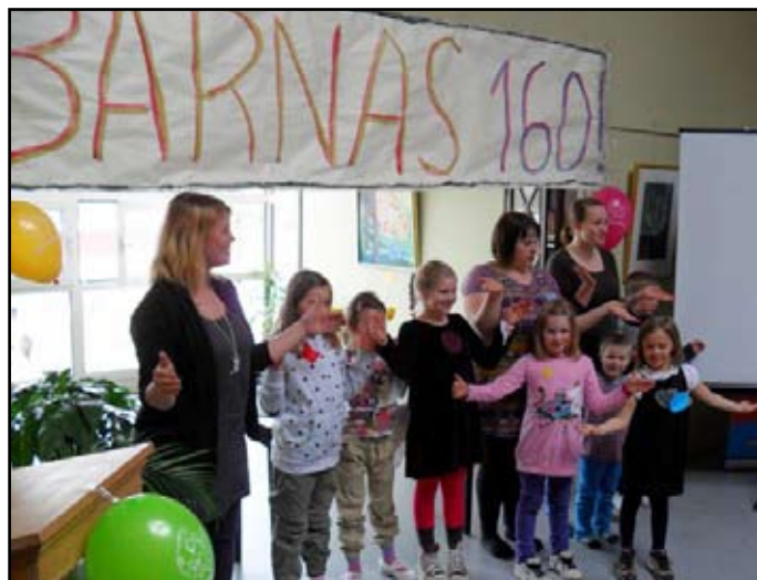
Barna med ledere synger til glede for forsamlingen.