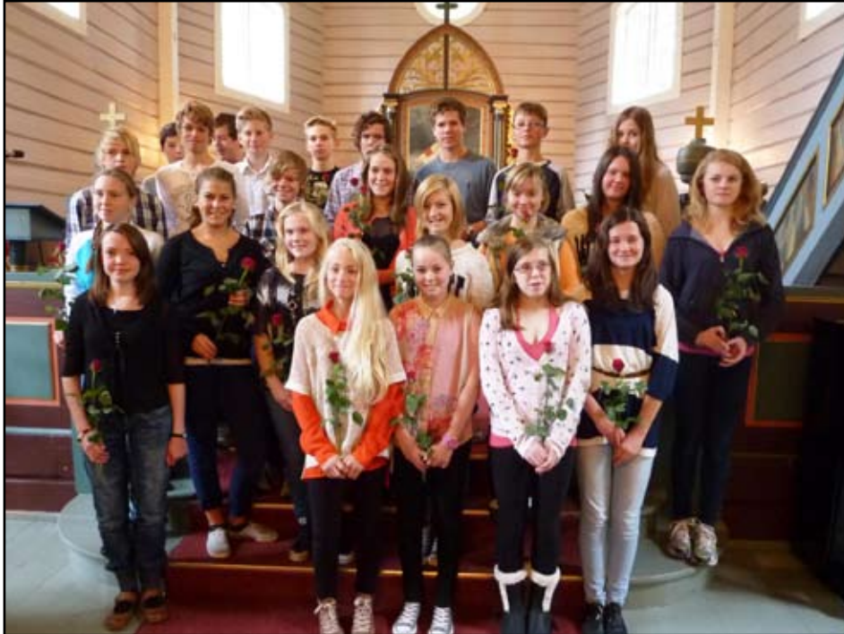
Årets konfirmantar i Øre kyrkje då dei vart presentert i haust.

Kyrjekontoret 71 29 39 00 Telefaks 71 29 38 28 E-post sokneprest: petter.dahle@ gjemnes.kommune.no Biletet: Øre kyrkje