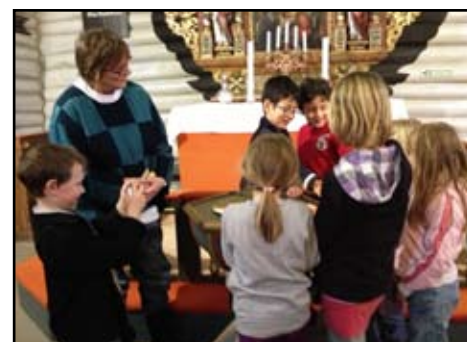
Her ble dukken døpt sammen med både prest, familie og faddere.