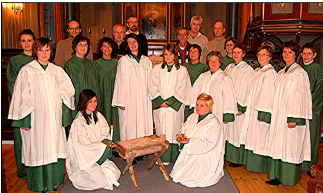
Bilete frå framføringa i 2008.