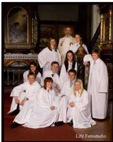
KONFIRMANTER I VALSØYFJORD KIRKE 09.05.2010