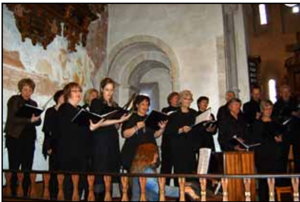
Deler av kor