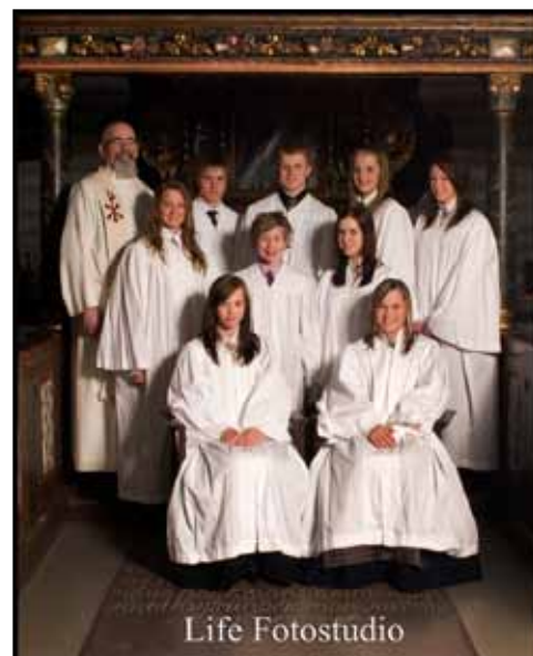
KONFIRMANTER I HALSÅ KIRKE 16.05.2010