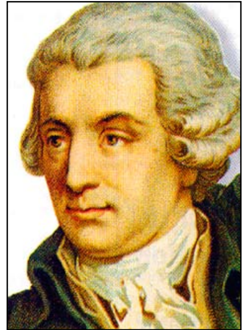
2009 er minneår for "Fader Haydn".