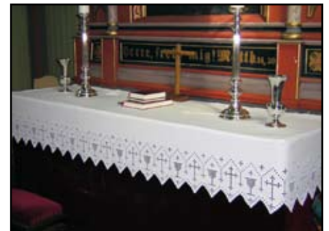
Møre bispedøme har gjort eit arbeid med å kartlegge alterdukar. Her er alterduken i Gjemnes kyrkje.

Dei dukane vi brukar i kyrkjene no, er vakre og gode. Men dersom nokon har interesse for å vere med å sjå på og evt. setje i stand nokon av dei gamle, må ein gjerne ta kontakt med kyrkjekontoret. Alteret er sentralt plassert i kyrkja. Det er bordet som kyrkjelyden samlast ved til Herrens måltid. Og der ligg duken og fortel at bordet er dekket og alt er klart.