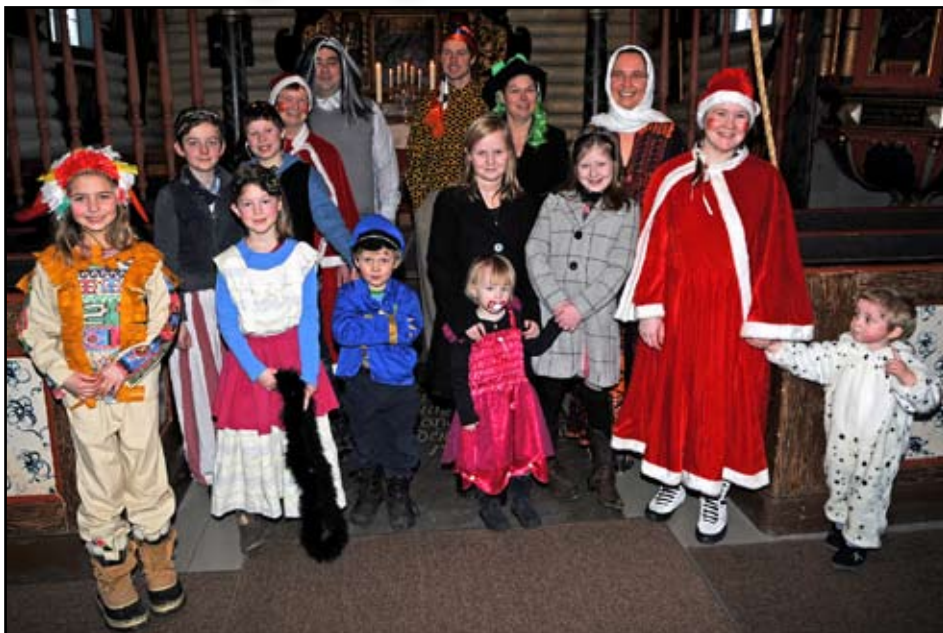
En bukkett av de som var med på gudstjenesta.

Livet er gitt oss av Gud. Da er det fint å få holde gudstjenester som gir rom for livsglede. Når små og store skal kle seg ut, settes drømmene og fantasien i sving. Leken