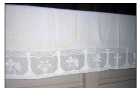
Den gamle duken i Øre kyrkje - i fileringsteknikk og med eit sjeldan mønster – vekte stor interesse.