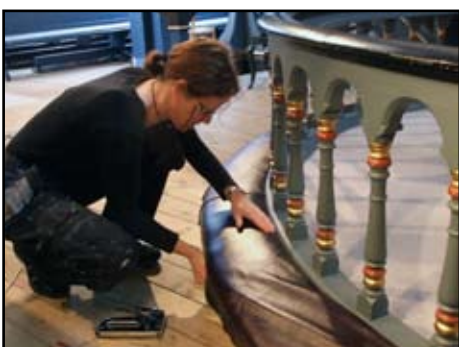
Alterringen trekkes med nytt skinn.