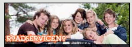
Ungdommene fra Roadservice vil gi konfirmantene fra Halså, Surnadal og Rindal en spesiell opplevelse 2. november.

Nysgjerrige finner mer på www.roadservice.no . Der forteller ungdommene om seg selv, og rapporterer fra stedene de besøker.