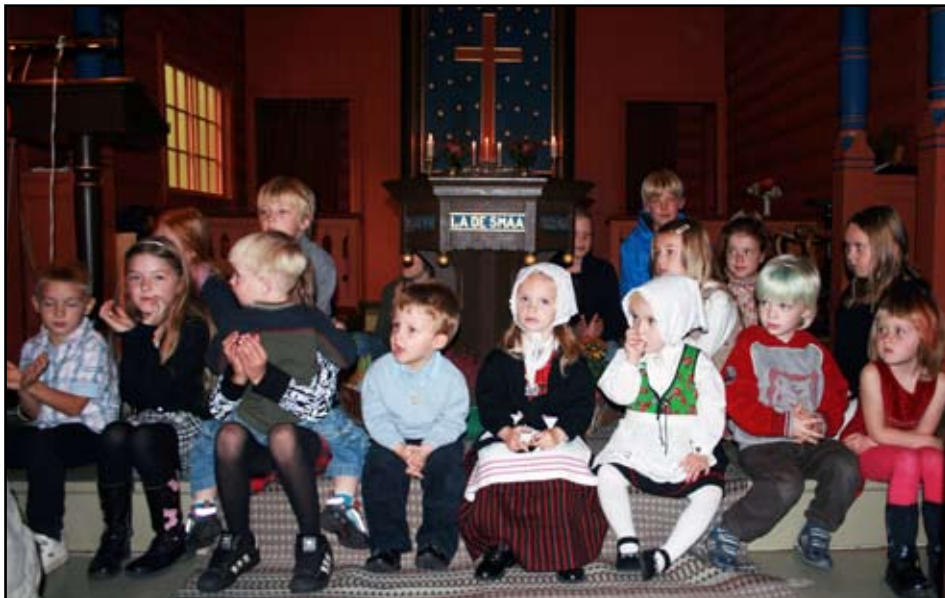
Søndagsskuleborn på hausttakkefest i Gjøre kapell.