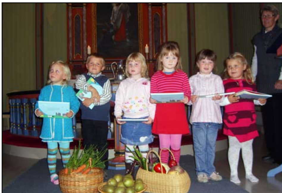
Her er nokre av dei som fekk kyrkjebok i Gjemnes.