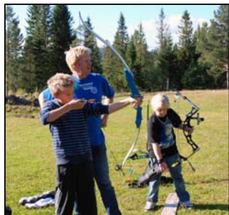
Bueskyting var en av aktivitetene på konfirmantleiren.