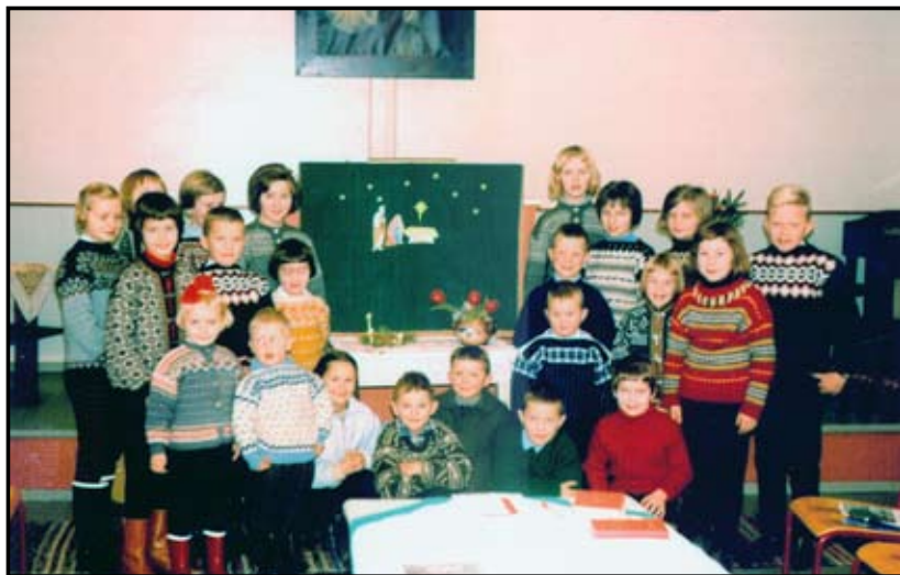
Søndagsskuleborn på 60-talet.