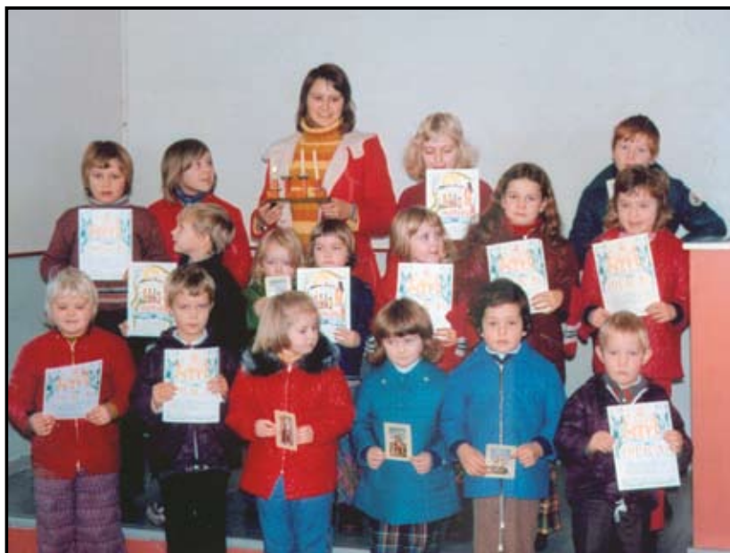
Søndagsskuleborn på 70-talet.