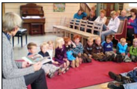
4-åringane i Øre var samla i kyrkja fredagen forut, for å gjere seg kjent i kyrkja og øve til søndagen.

Samtidig med haustattakkefest var 4-åringane invitert til kyrkje for å få si kyrkjebok. Dei aller fleste møtte opp i kyrkja, og mange hadde med seg både foreldre, besteforeldre og familie elles.