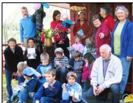
Søndagsskulen på hyttetur i 2007.