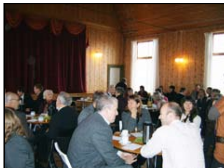
Kyrkjekaffen i Bondehuset samla også fullt hus til ei feststund med flotte kaker, fint program, helsingar og gåver.

I preika fortalde han dramatisk og levande om si lengste reise gjennom Sibir til misjonærteneste i Japan for 40 år sidan. Etter mykje uro og engsting var han lukkeleg over å sjå ein kjent person som møtte han på kaia i det framande landet. Ut frå dagens tekst frå Joh 17,1-8, der Jesus seier at det evige livet er å kjenna han, kobla han dette til vår livsreise der vi ikkje veit så mykje om korleis det er i det framande landet vi er på reise til. Men det betyr ikkje så mykje