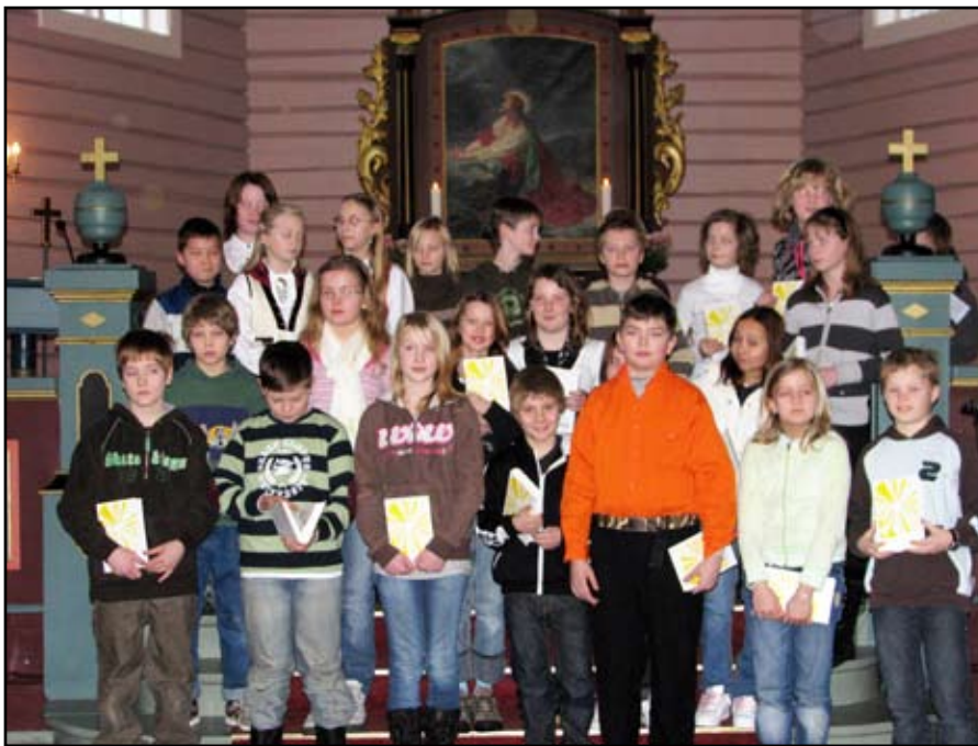
Her ser vi 5.-klassingane som fekk bibel i Øre kyrkje.

Bibelutdeling er første punkt i kyrkje-lydane sitt arbeid overfor denne aldersgruppa, vi kallar det 11-årsfasen. Snart reiser dei på eit døgn leir i Flemma, og til hausten kan dei starte på KRIK 11.