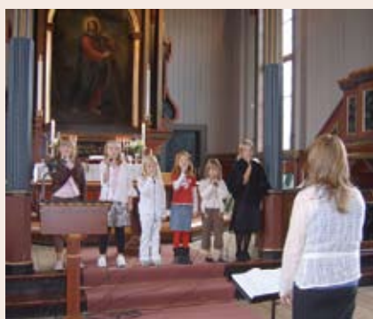
Barnekoret deltok på jubileumsgudstjenesten.