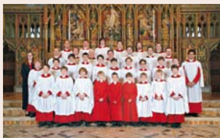
Slik ser dei ut – kom og hør dei også!

Gloucester Cathedral Choir konserterer i samband med Kristiansund Kirke Kunst Kultur-Festival og gjestar Stangvik kyrkje fredag 21. september kl. 19. Laurdag syng dei i Molde Domkyrkje og søndag i Nordlandet kirke i Kristiansund.