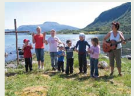
Ei korgruppe deltok på gudstenesten på Ikornneset.

Både på Ikornneset og Svanavollen vart det gudstenester i år også – med fint ver og svært godt frammøte.