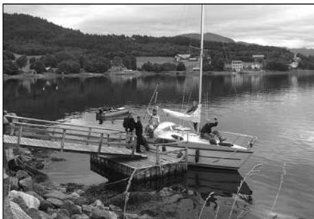
Vi går om bord på Nesjestranda.

Sagaøya Veøy ligg midt i Romsdalsfjorden, og var eit sentrum i området i fleire hundreår. Dagen på Veøya starta med gudsteneste i steinkyrkja frå middelalderen, ei av mange kyrkjer som har stått på øya. Denne kyrkja var soknekyrkje for Veøy sokn heilt fram til 1907, då den nye Veøy kyrkje vart bygd på Sølsnes. Den alltid veltalande Bjørn