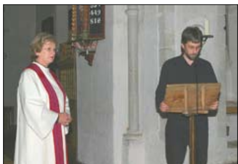
Leiaren i Straumsnes sokneråd las kallsbrevet frå biskopen.

Prost Aarset sa dei følte seg fantastisk privilegerte som skulle få gjera teneste på ein slik plass og bu i eit slikt hus som den gamle prestegarden.