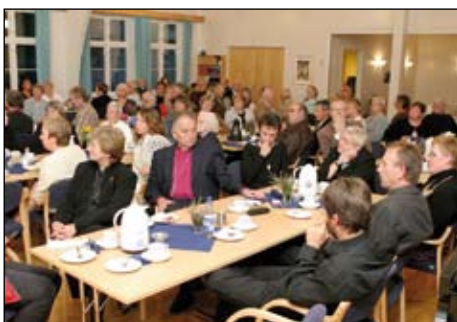
Hyggeleg og fin kyrkjekaffe etter gudstenesta.