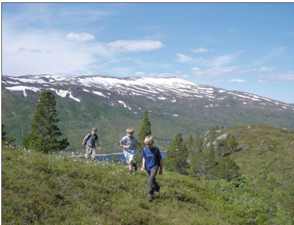
Trusopplæring på fjellet.