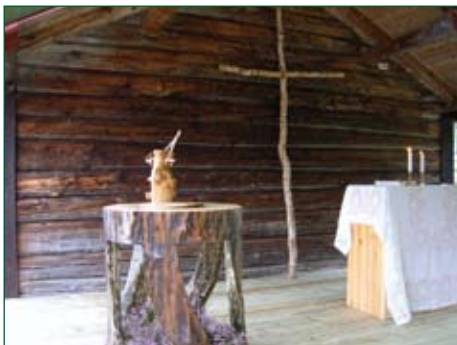
Den nye døypefonten er laga av poppel, mugga og fatet av bjerk.