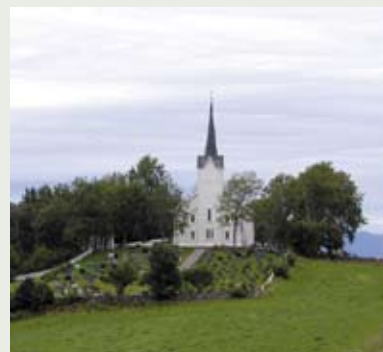
Gjemnes kirke er åpen i sommer. Se www.kirken.no/veikirker/ for oversikt over flere veikirker og andre åpne kirker.

I sommer blir kirka åpen 4 uker i juli – hver dag mellom kl. 12 og 17. Vi gleder oss med de mange som kommer innom til ei pause, til å se seg om, til bønn eller meditasjon. Erfaringen tilsier at de fleste som stopper er utlendinger, men mange norske – også fra egen menighet – avlegger gjerne kirka et besøk.