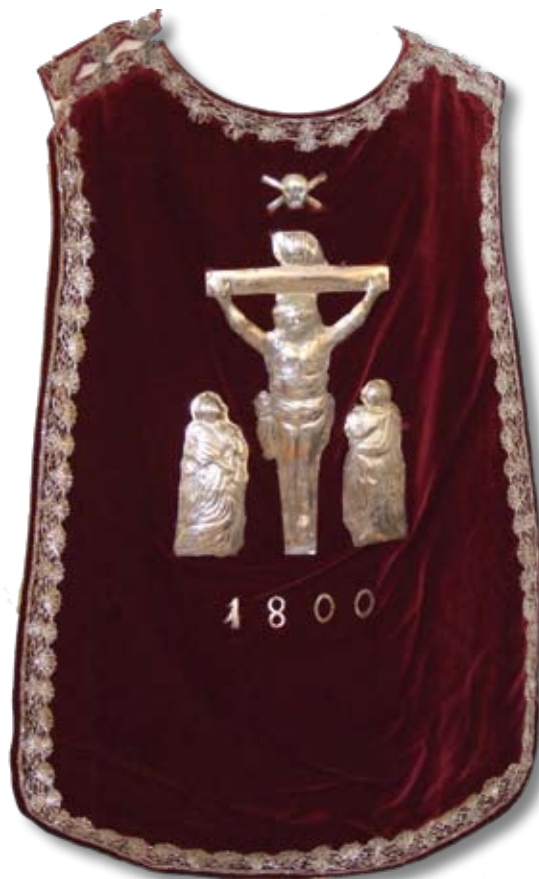
Messehakel frå Øksendal. Stoffet i hakelen er frå 1920-talet, mens resten er frå ein hakel som vart laga på 1800-talet.

Det er mykje vakker kunst rundt om i kyrkjene våre. Kunstnarevner er gjeve menneska frå Gud, og mange har opp gjennom historia, frå Moses og Arons tid, brukt desse evnene i teneste for han og til å æra hans namn. Kunsten i kyrkjene skal og hjelpa oss til å forstå innhaldet i gudstenesta og evangeliet.