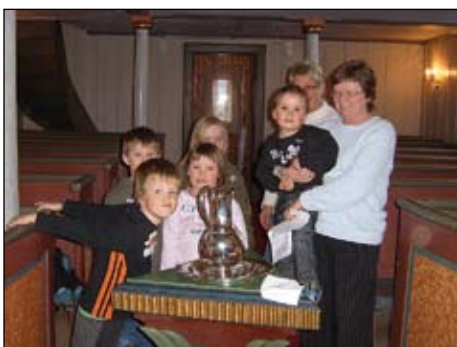
Samling om døypefonten i Mo kyrkje.