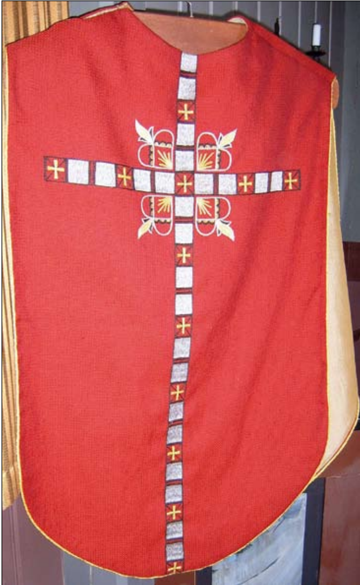
Raud messehakel frå Åsskard kyrkje.

Når presten bruker liturgiske klede, er det eit uttrykk for at det ikkje er presten som privatperson, men presten i rolla som Guds tenar vi møter.