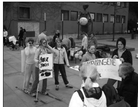
Konfirmanter på skitur i Molde.

Neste nummer kjem 20. september. Frist for innsending av stoff er 20. august.