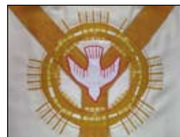
Utsnitt frå messehaklane i Valsøyfjord kyrkje.