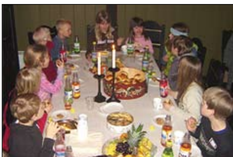
Så var det bollar og "orgelbrus" etter vandringa – som her i Todalen.