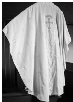
Den kvite messehakelen i Mo kyrkje er laga av Marit Moen.

for nytt sokneråd. Det vart ein lang prosess frå ho fekk oppdraget til messehakelen kunne presenterast.