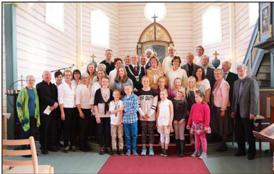
Alle medverkande under visitasgudstenesta – stor involvering!

Bispevisitas – til glede, inspirasjon og utfordring – slik opplevde dei fleste av oss visitasen i Gjemnes og Øre. Det omfattande programmet førte til gode møte med barnehage, skuleelevar og lærarar, speidarar,